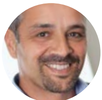
Менеджер по сестринскому уходу