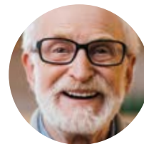
ທ່ານໝໍຂອງທ່ານ