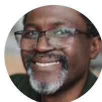
ຜູ້ຊ່ວຍຊານຂອງພວກເຮົາ