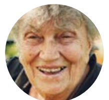
ທ່ານ, ສະມາຊິກ

ຜູ້ປະສານງານເບິ່ງແຍງດູແລ ແລະ ຜູ້ຈັດການແພດເບິ່ງແຍງດູແລຂອງພວກເຮົາຈະຊ່ວຍທ່ານຈັດການກັບຄວາມຕ້ອງການທາງການແພດ, ພ້ອມກັນກັບບໍລິການຊຸມຊົນ ແລະ ສັງຄົມ.