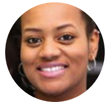
ຜູ້ປະສານງານການເບິ່ງແຍງດູແລຂອງທ່ານ