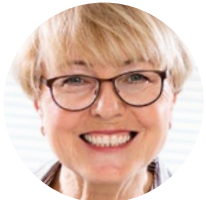
Peb Cov Kws Kho Mob Uas Paub Zoo Rau Tej Suam