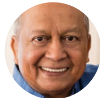
Koj Cov Kws Kho Mob