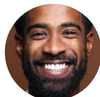
Cov Neeg Koom Tes Hauv Lub Zej Zos