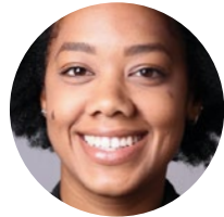
Koj, tus tswv cuab

Tus Kws Tu Neeg Mob Uas Muaj Ntaub Ntawv Raug Cai thiab Tus Neeg Ua Hauj Lwm Pab Tib Neeg muaj peev xwm pab tau koj nrog rau cov kev xav tau ntsig txog kev kho mob, ua ke nrog rau cov kev pab cuam rau hauv lub zej zos thiab sim neej.