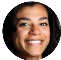
Tus Kws Tu Neeg Mob Uas Muaj Ntaub Ntawv Raug Cai/Tus Neeg Ua Hauj Lwm Pab Tib Neeg