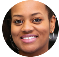
您的诊疗护理协调员