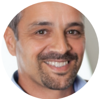
护士诊疗 护理管理员