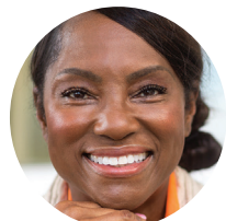
Menadžer za medicinske sestre/tehničare