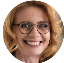
Vaš menadžer za pružanje usluga zdravstvene nege