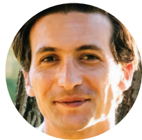
Registrovana medicinska sestra/tehničar