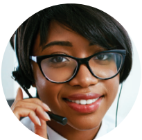
Pomoćnik za slučaj