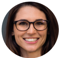
Koj Tus Kws Kho Mob