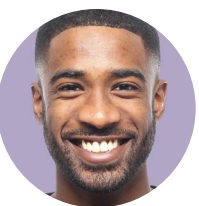
ຜູ້ຊ່ຽວຊານຂອງພວກເຮົາ