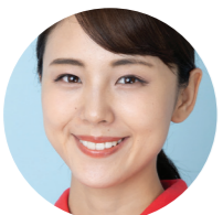
Vaš koordinator za pružanje usluga zdravstvene nege