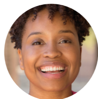
Partner u zajednici