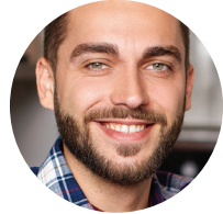
Usted, el miembro

Nuestros coordinadores asistenciales lo ayudarán a gestionar sus necesidades médicas, así como a conectarlo con servicios sociales y comunitarios.