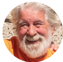
Koj, tus tswv cuab

Koj tus Thawj Tswj Saib Xyuas thiab koj tus Kws Kho Neeg Mob (RN) uas tau sau npe lawm yog ob tug uas koj yuav tau hu thiab yog tus thawj tswj tseem ceeb ntawm koj qhov kev npaj rau kev saib xyuas