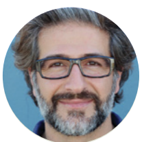
Peb Cov Kws Txawj Tshaj Lij