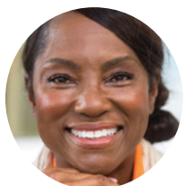
Sestra Menadžer za medicinske sestre/tehničare