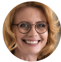
Menadžer Vaše nege